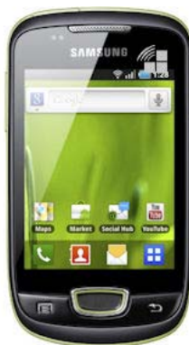
SAMSUNG Galaxy Mini