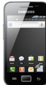
SAMSUNG Galaxy Ace