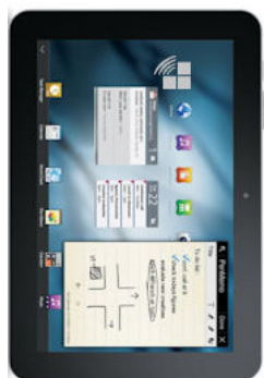
SAMSUNG Galaxy Tab 10'1 3G