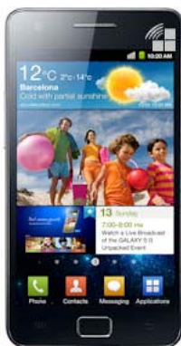
SAMSUNG Galaxy S II