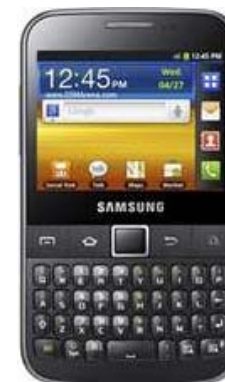
SAMSUNG Galaxy Y Pro